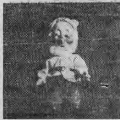
DOC SEGUNDA CARRERA

RECORTE ESTA FOTO y PEGUELA en el Cuadro de la carrera que se publicó el DOMINGO