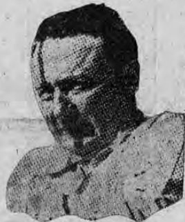
Gobernador, George Howard Earle, de Pennsylvania

CIUDAD DE MEXICO, 15. UP. El gobernador del estado de Pennsylvania, George Howard Earle III llegó a esta capital a las dos y 50 minutos de la tarde de hoy por la vía aérea, pilotando su propio avión. El prominente político norteamericano, de quien se habla como de un posible candidato a la presidencia de los Estados Unidos del Partido demócrata, viene acompañado de su señora esposa y un piloto. Entrevistado por la UNITEED PRESS el gobernador declaró que venía de Brownsville, Texas, y que tenía la intención de efectuar un vuelo de paso por los países de Centro y Sur América. El gobernador tiene fama como deportista siendo muy adicto a la pesca.