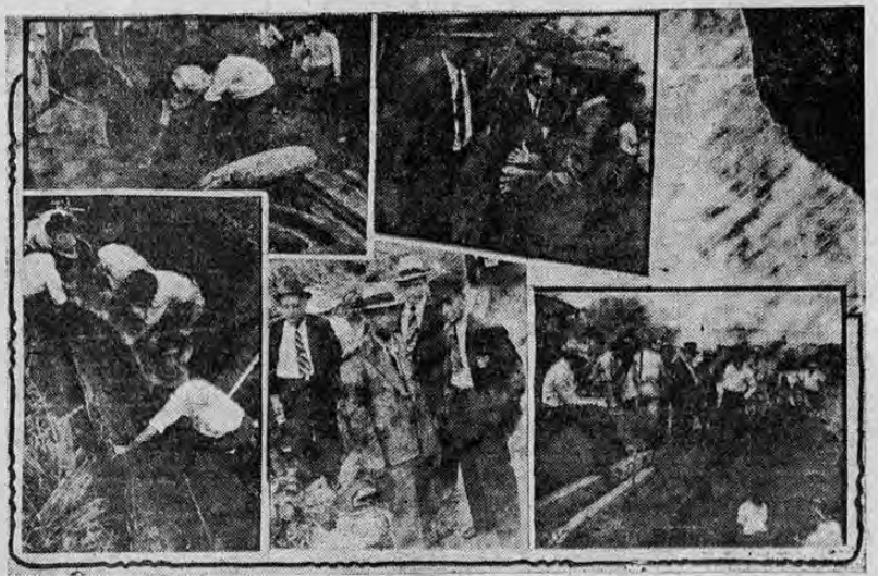
Diversos aspectos de los trabajos de composición del desperfecto de la cañería capitalina en San Juan de Tres Ríos. Los trabajadores en acción; el presidente municipal y el Lic. Chaves oyen la explicación del suceso; el tubo dañado; los señores Rodó y Truque con dos empleados de LA TRIBUNA; el gobernador inspecciona los trabajos.